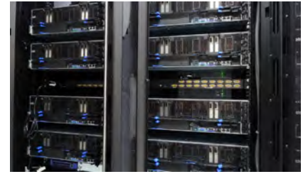
NVIDIA® Tesla® V100を8基搭載するNVIDIA DGX-1™は、データセンターに設置されている